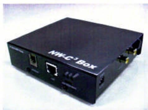
138mm(W) x 125mm(D) x 36.5mm(H) (突起物は除く)